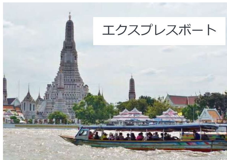
エクスプレスボート