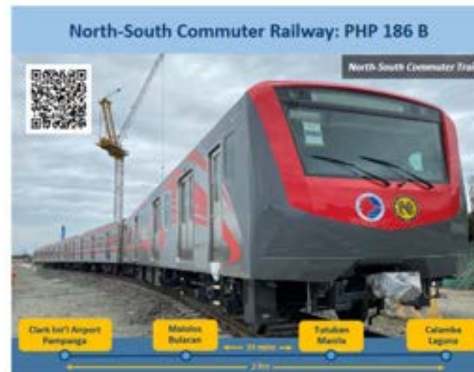
マニラ首都圏～近郊における南北通勤鉄道の開通 北：パンパンガ州クラーク国際空港 南：ラグナ州カランバ 2028年開通予定