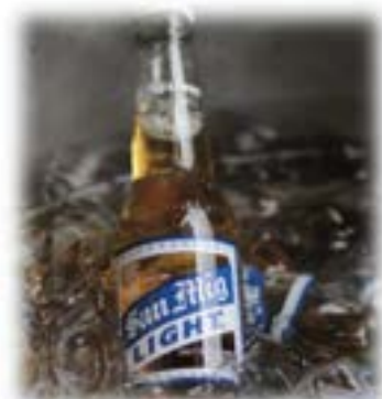
SAN MIGUEL BEER