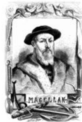
フェルディナンド・マゼラン