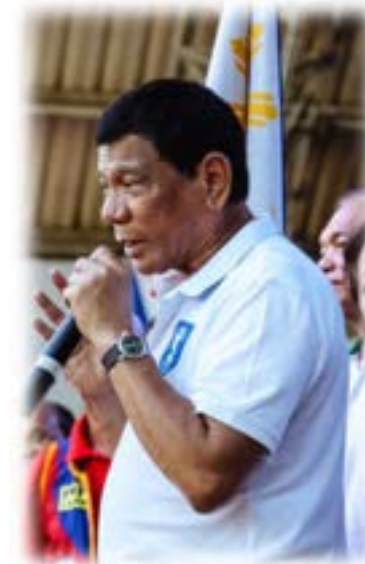
Rodrigo Duterte ロドリゴ・ドゥテルテ