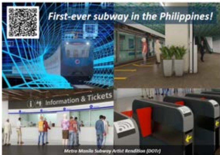
フィリピン初の地下鉄（マニラ首都圏） 2028年開業予定