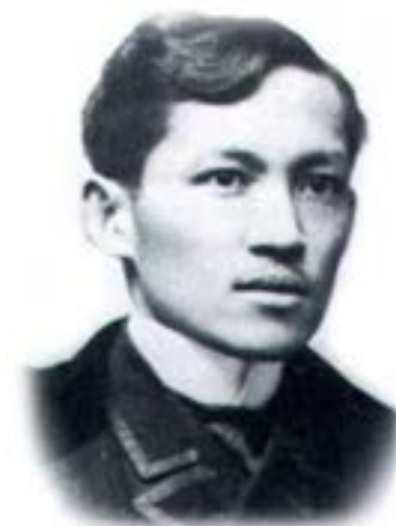
フィリピンの英雄 ホセ・リサル